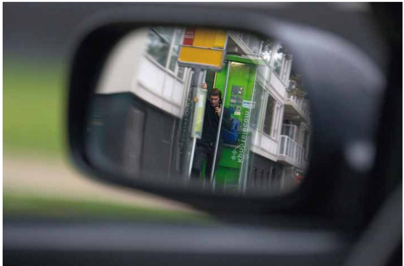
Rechercheurs van het observatieteam houden een mogelijke verdachte in de gaten (in scene gezet).