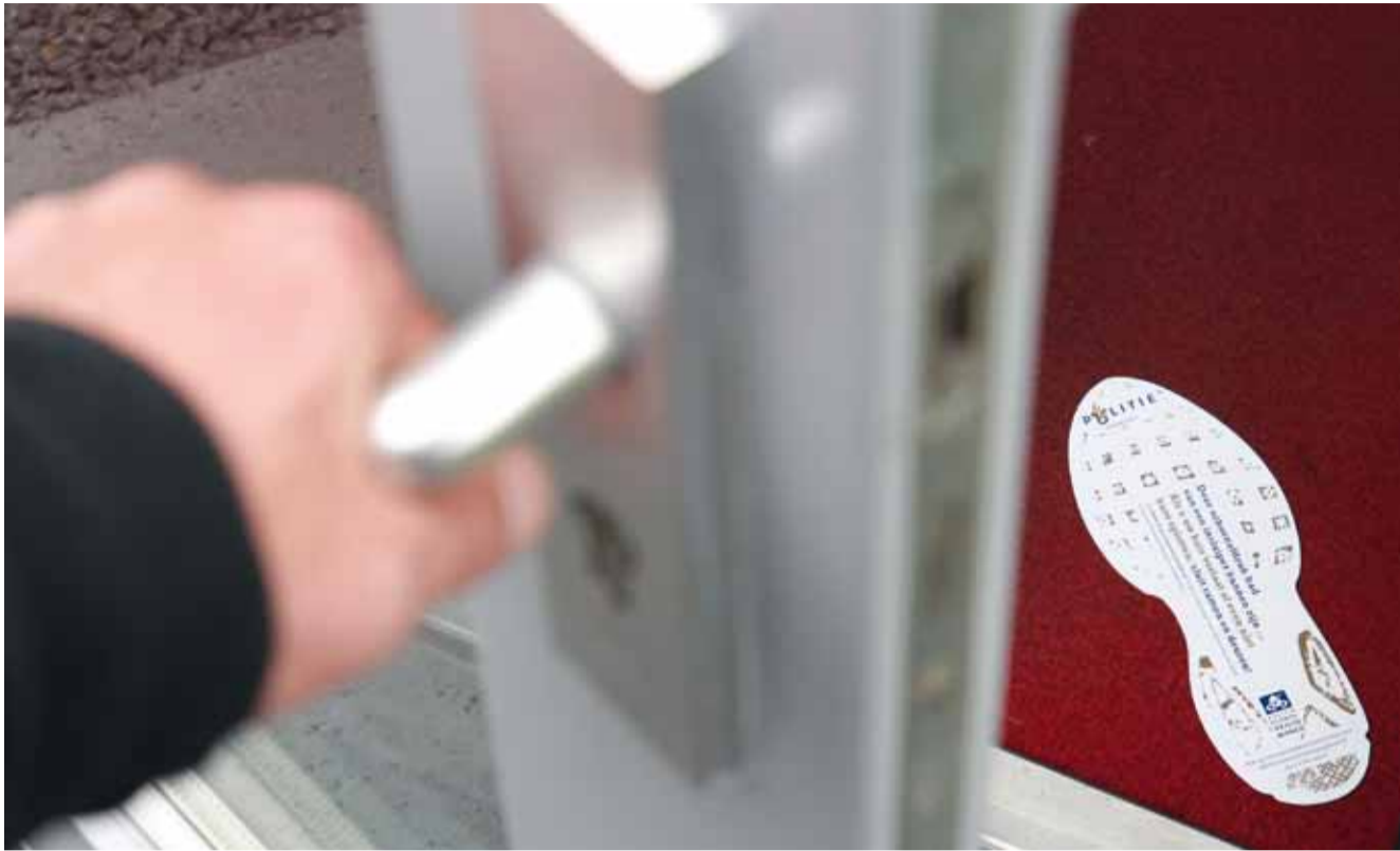
Deze schoenafdruk had van een inbreker kunnen zijn.