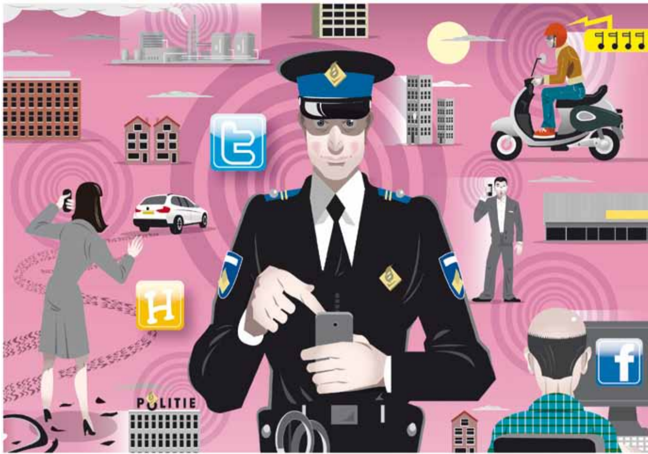
Twitter, Burgernet, website voor jongeren; door deze digitale media kan de politie doelgericht veel mensen bereiken en informeren.