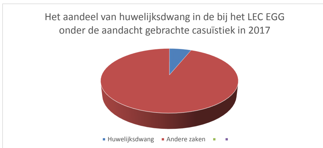
Figuur 5: Het aandeel van huwelijksdwang in het werkaanbod van het LEC EGG

In het peiljaar 2017 werden in totaal door de regionale eenheden 1496 zaken behandeld, waarbij rekening werd gehouden met een eermotief. Bijna een derde van die zaken (n=456) werden complex gevonden. Om die reden werden zij ook voorgelegd aan het LEC EGG. Bij elf procent van de zaken die in 2017 aan het LEC EGG werden voorgelegd speelde dwang een rol (n= 49) (LEC EGG, 2018). Ruim de helft van die zaken (n=28) werd in verband gebracht met het fenomeen huwelijksdwang. Bij die andere zaken speelden dwang een rol bij andere gedragingen, zoals achterlating (n=18). Het aandeel van huwelijksdwang in het totale werkaanbod van het LEC EGG is met zes procent, zoals figuur 5 laat zien, relatief klein.