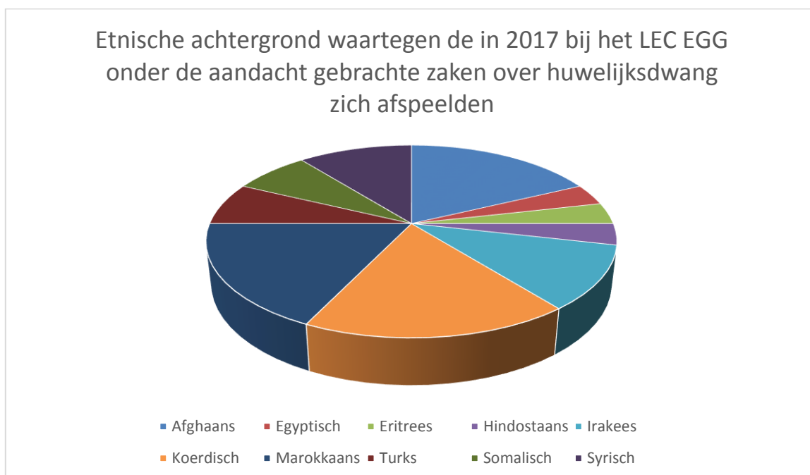
Figuur 6: Etnische achtergrond bij huwelijksdwang in het werkaanbod van het LEC EGG