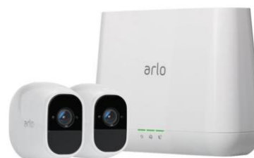
Arlo pro (1 eenheid)