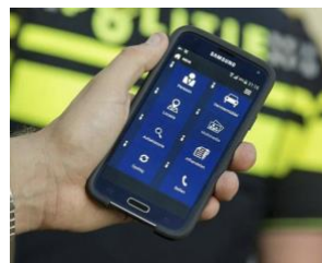
Diensttelefoon (4 eenheden)