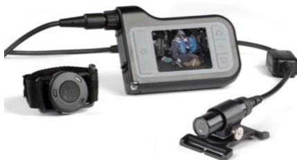
Zepcam T1 (2 eenheden)