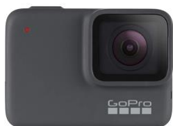
GoPro (4 eenheden)