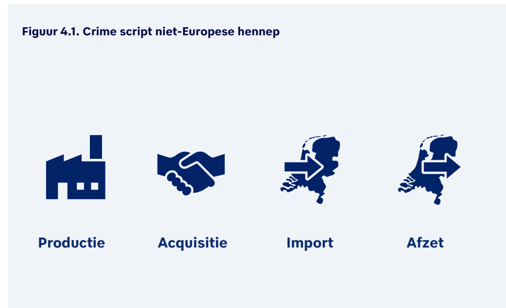
Figuur 4.1. Crime script niet-Europese hennep

Voor Nederlandse criminele subjecten en netwerken geldt: handel is handel. Opportunisme voert de boventoon. Er wordt gehandeld in verschillende soorten drugs (polydrugs) en als andere lucratieve handel zich voordoet, dan doen ze dat ook. Denk aan illegale sigaretten, illegale medicijnen en vuurwapens (Politie, 2022). De drugshandel en daar aan voorafgaande drugsproductie kenmerken zich door een marktgeoriënteerd verdienmodel. Er wordt winst gemaakt door het overbruggen van aanbod en vraag (zie Kruisbergen et al., 2012). Binnen de mondiale drugsmarkt kunnen vraag en aanbod dan ook niet los van elkaar worden gezien, en de markt kan zowel vraaggestuurd als aanbodgedreven zijn: zonder gebruikersmarkten geen aanbod en het aanbod creëert ook weer (nieuwe) afzet (Vermeulen et al., 2024). Nederlandse criminele netwerken en subjecten spelen hierop in en de ontwikkelingen in relatie tot de handel in niet-Europese hennep kunnen we in deze context plaatsen. Maar hoe ziet het achterliggende criminele bedrijfsproces in relatie tot import van en de handel in niet-Europese hennep er dan uit en welke rol spelen Nederlandse subjecten en netwerken daarbij? In dit hoofdstuk werken we deze vragen uit aan de hand van een crime script niet-Europese hennep (zie figuur 4.1). Achtereenvolgens komen de bouwstenen productie, acquisitie, import en afzet aan bod. De positie van Nederland is daarbij leidend.